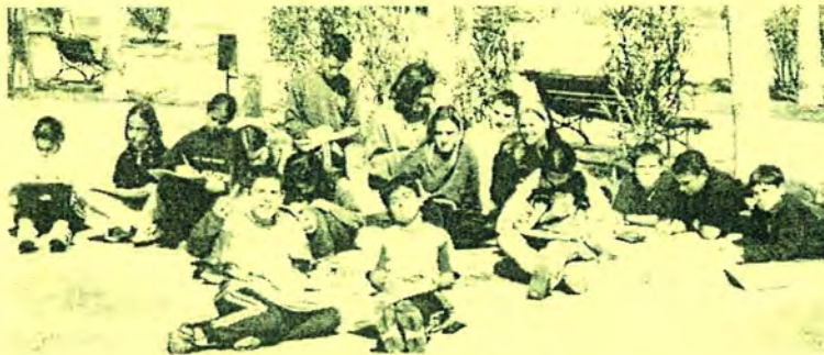
Alumnes de 1r dibuixant la façana de l'institut