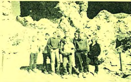
ELS ALUMNES DE 5é AL PEU DEL TEIDE. (GRAN CANÀRIES)

El dimecres vam anar tot el dia a los “Lagos Martivaez”. Feia molta calor!