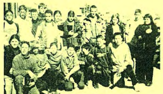
Visita al Museu del Suro 2n ESO