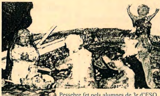
Pessebre fet pels alumnes de 3r d'ESO