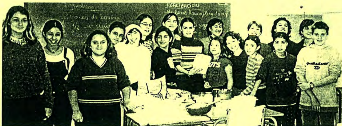
Alumnes del taller de cuina fent una coca.