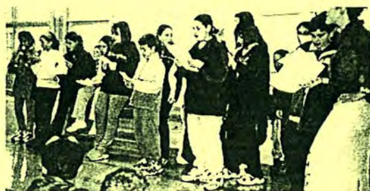
Alumnes de 1r cantant nades en anglès.