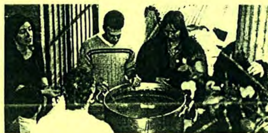
Els professors repartint xocolata.

Més tard, els alumnes de 1r i 2n van fer la xocolatada al pati. Els del crèdit variable de "Cant coral" van cantar a la Sala d'Actes i l' alumne