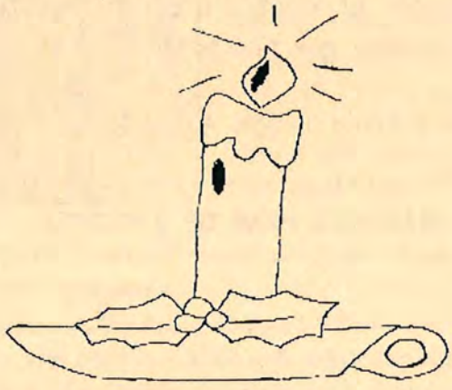
Busca les 10 diferencies