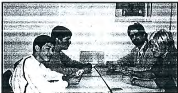
Volen sortir molt guapos, a la foto, però no somriuen.