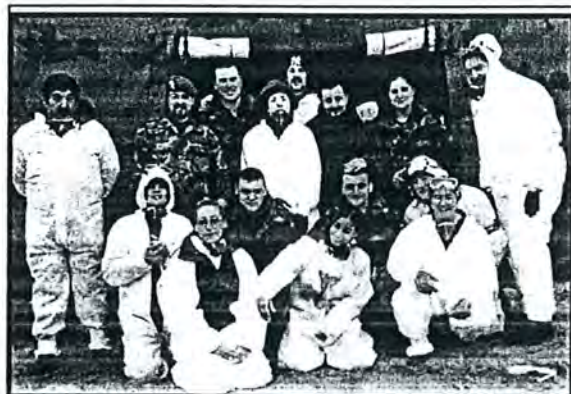
Els voluntaris palamosins entre els quals hi ha gent del nostre centre