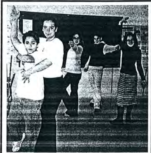
Mireu com ballen sevillanes, i només hi ha un nen, es molt atrevit.