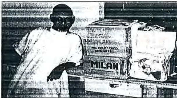
Un saharai amb el material que varen portar