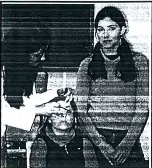
Aquesta noies estan molt maques pintades, semblen models.