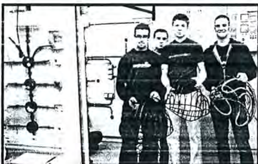
Alguns dels alumnes amb les estructures.

Els llums de Nadal d'aquest any a Palafrugell, els van fer els alumnes de 1r. i 2n. d'electricitat (cicle formatiu grau mitjà) del nostre institut. L' Ajuntament de Palafrugell els va proposar fer-los i l' institut amb molt de gust van acceptar.