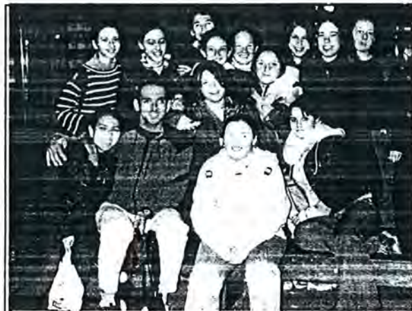
Els alumnes volien una foto amb el Berenguer

Després vam anar al Passeig de Gràcia a veure la casa de Lleó Morera, la casa Batlló i la Pedrera, i per cert, tots ens vam quedar impressionats en veure les façanes de les cases. Més tard vam anar al