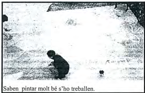
Saben pintar molt bé s'ho treballen.

van anar a veure vídeo o quina, que uns dies abans ja havien triat; quan van acabar, van anar al pati, com un dia normal i corrent. Ja acabat el pati, van fer els tallers que també van triar. Hi havia molts tallers, des de manualitats, a esports.