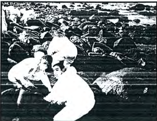
Un grup de voluntaris traient fuel de les roques .

Molt, veus allò i penses ,no sé com ens ho farem!