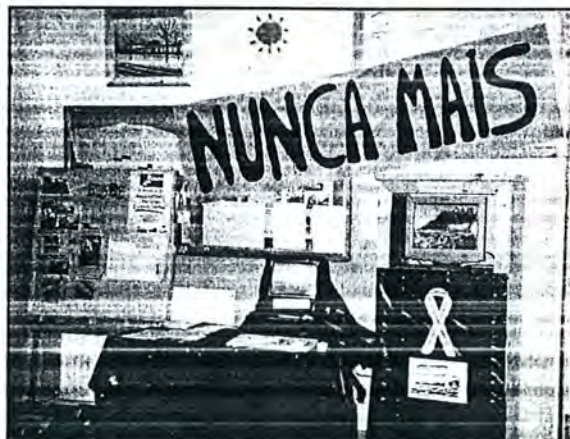
El centre també es va solidaritzar amb els gallegos i vam recollir firmes .