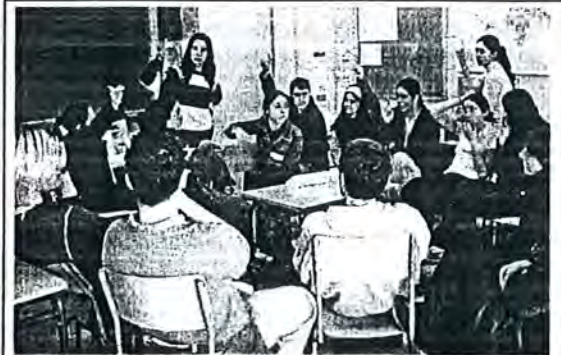
Els participants del concurs del "Periódico".

també. Va ser una mica caòtic, però al final tot va sortir bé. Va ser una bona experiència.