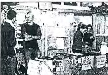
Els alumnes venien coques per la fundació de Vicenç Ferrer.

Els hindús tenen costum de fer un dibuix a l'entrada de cada casa perquè diuen que porta sort a la família, es diu "Granuli", i és obligatori fer-lo a l'Índia.