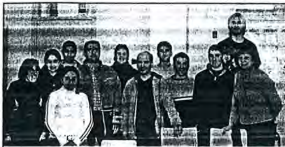
Aquí ens trobem, els dos antics alumnes i nosaltres