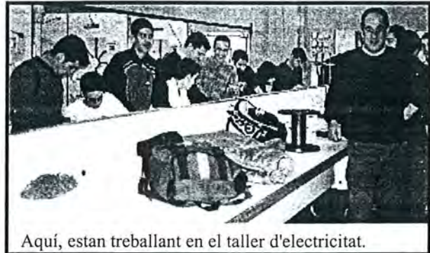
Aquí, estan treballant en el taller d'electricitat.